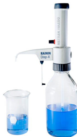
Tappo dosatore Disp-X